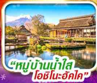
“หมู่บ้านน้ำใส โอชิโนะฮัทสึ”