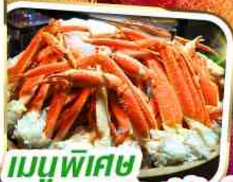
เมนูพิเศษ บุฟเฟ่ต์ขาปูยักษ์