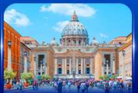
นครรัฐวาติกัน โรม