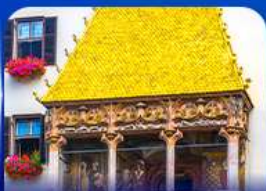
หลังคาทองคำ อินส์บรุค