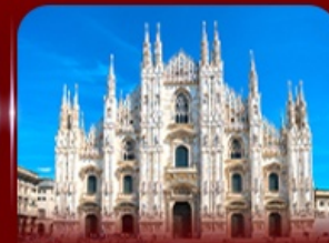
เข็ควินมหาวิหารดูโอโม มิลาน