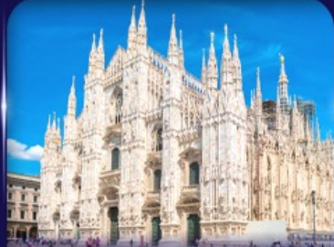
เข็ควินวิหารดูโอโม มิลาโน