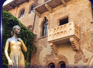
เยือนบ้านจูเลียต เวโรนา