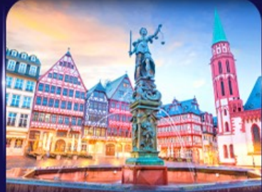
จัตุรัสโรเมอร์ แพรงก์เฟิร์ต