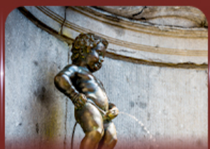
manneken pis บรัสเซลส์