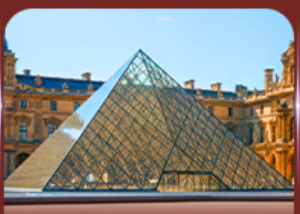
เซ็งอินพิพริกันท์ลูฟวร์ ปารีส