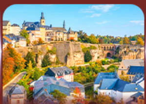
ย่านเมืองเก่า ลักเซมเบิร์ก