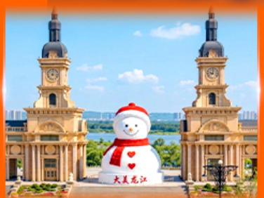
ตึกตาสหิมะยักซ์ ฮาร์บิน