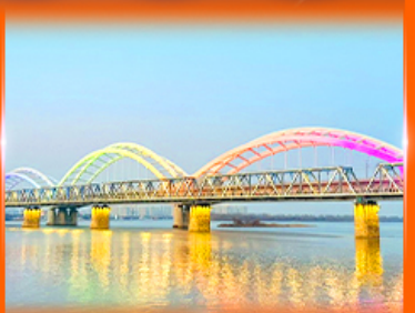
สะพานรถไฟปินโจว