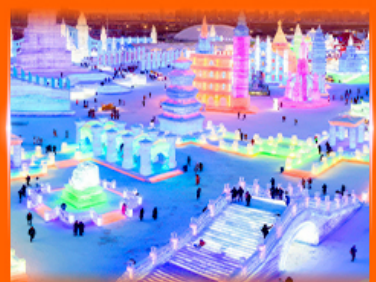
เที่ยว ICE & SNOW WORLD