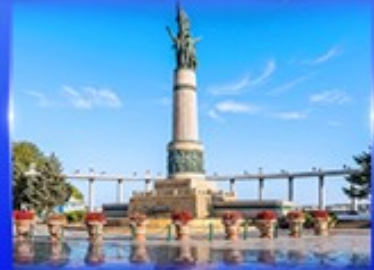
อนุสาวรีย์นิ่มหง