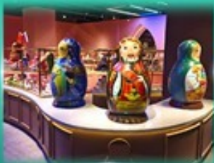
พิพิธภัณฑ์ ตุ๊กตาเปลูกอด