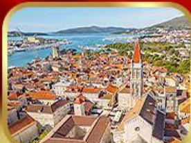
มหาวิหารเซนต์ลอว์เรนซ์