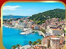
ชมย่านเมืองเก่าสปลิก

14-21 พ.ค. 18 ที่สุดท้าย 73,333.- ปรับลดจาก 75,555