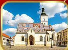
โบสถ์เซนต์มาร์ก ซาเกรบ