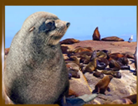
ส่องเรือชมฝูงแมวน้ำ Seal Island