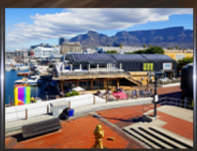
ท่าเรือ V&A waterfront