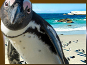
Simon's Town ชมฝูงเพนกวิน