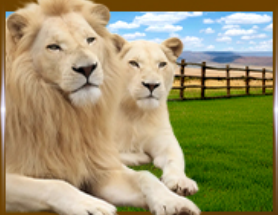
The Lion Park