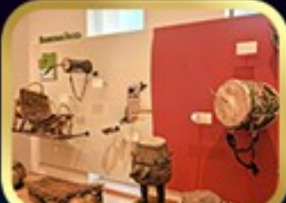
Museum of Folk Instrument