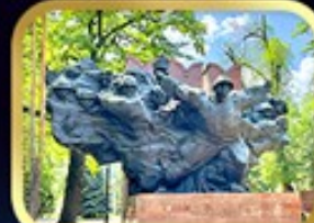
Panfilov Guardsmen Park