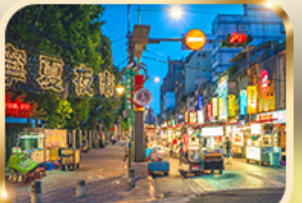
หนิงเซี่ย ไนท์มาร์เก็ต