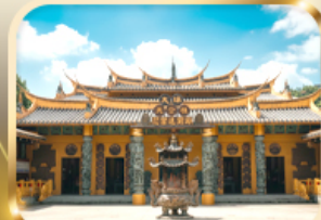
วัดต้าซี ขอความรวย