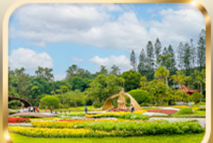
สวนบ้านปรน.เจียงไคเช็ก