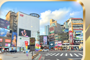
ช้อปปิ้งย่านซีเหมินติง