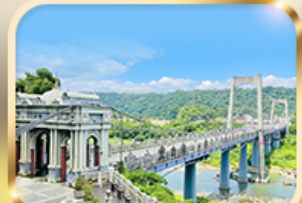
สะพานต้าซี เกาหยวน