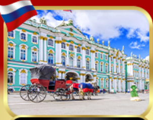
เช่าชมพิพิธภัณฑ์ออร์มิตา