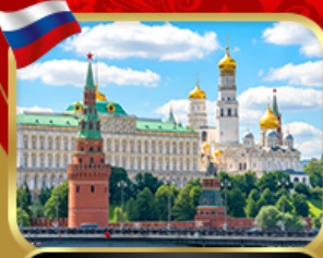
พระราชวังเครมลิน