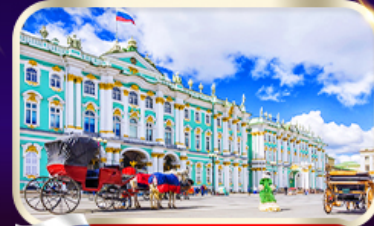
พิพิธภัณฑ์ฮอร์มิก้า