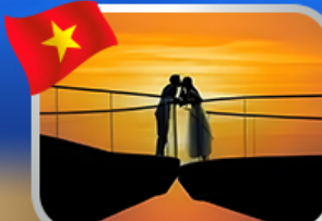
ชมอาทิตย์ตก ณ สะพานงู