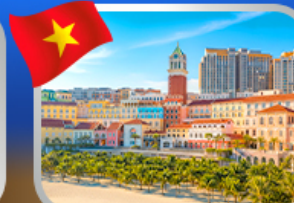
Sunset Town Phu Quoc