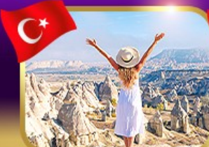
ชมความงาม หุบเขาแห่งรัก