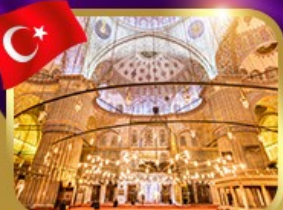
เข้าชมความงามสุหร่าซีน้ำเอน