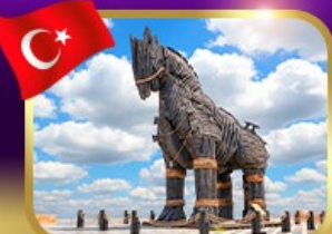
ม้าไม้เมืองกรอย ซานักคาล่