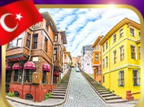
ชมบ้านหลากสีย่านขาลิก