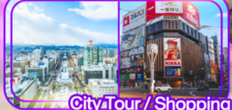
City Tour / Shopping