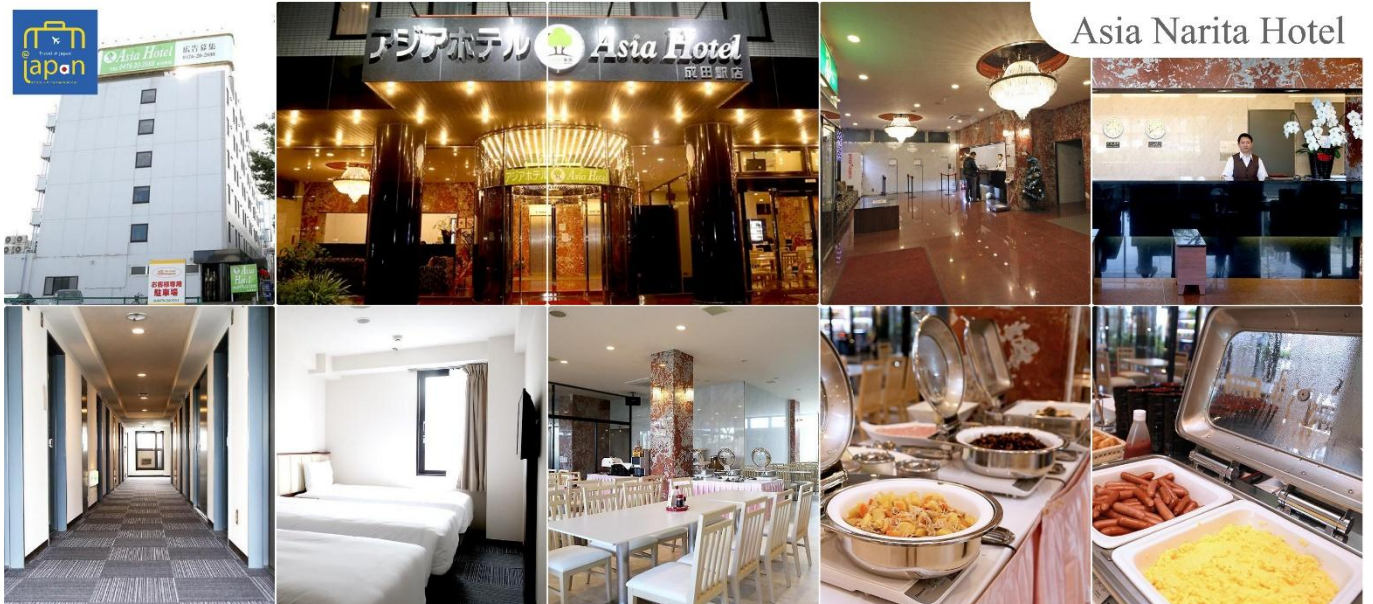
Asia Narita Hotel

พักที่ ASIA HOTEL NARITA หรือเทียบเท่าระดับเดียวกัน