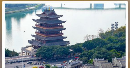
ถนนสามสายสองตrock