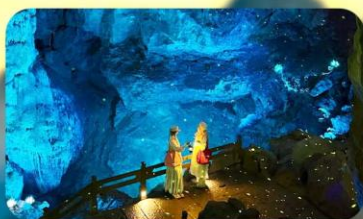
ถ้ำหลุย้อ