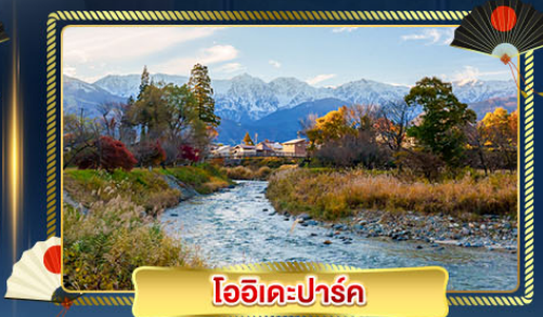
โออิเคะปาร์ค