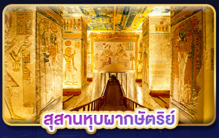
สุสานทูปผากษัตริย์