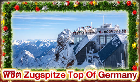
พีชิต Zugspitze Top Of Germany