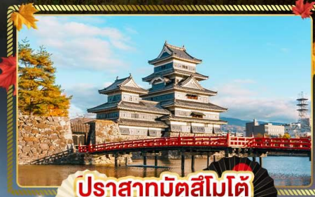
ปราสาทมัทสึโมโตะ