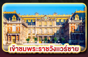
เข้าชมพระราชวังแวร์ซาย