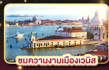
ชมความงามเมืองเวนิส