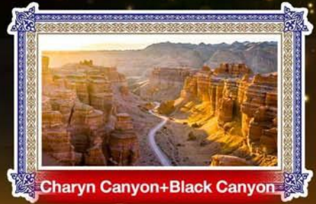
Charyn Canyon+Black Canyon