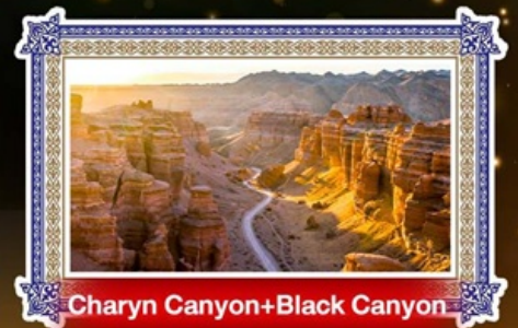
Charyn Canyon+Black Canyon