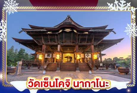
วัดเซ็นโคจิ นากาโนะ