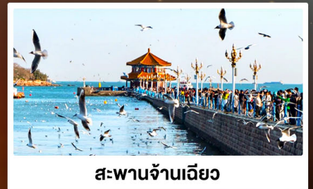
สะพานจ้านเฉียว