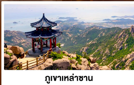
ภูเขาเหล่าซาน