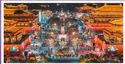
ถนนวัฒนธรรมราชวงศ์ถัง