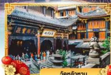
วัดหลัวหลาน