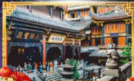
วัดหลิวทาน