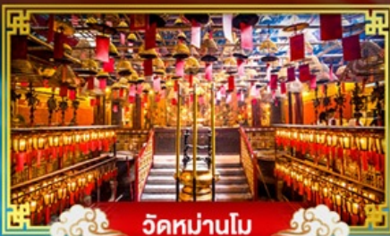
วัดหม่านโม

พักกลางวัน "ริมพาร์ก" บินรดลองเทศกาลปีใหม่ ณ เกาะฮ่องกง