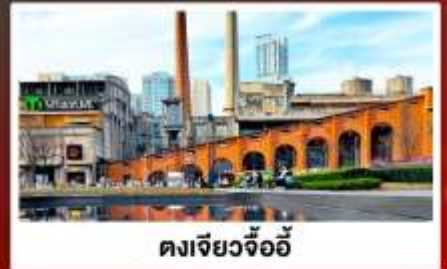
ตงเจียวจื่ออี้