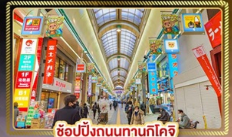
ช้อปปิ้งถนนทานุกิโคจิ