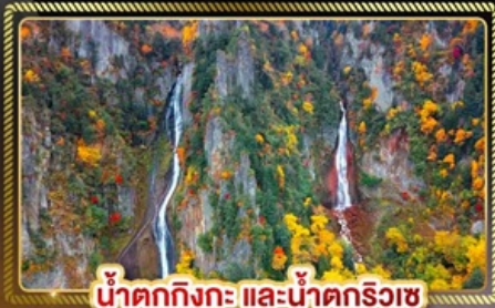
น้ำตกกิงกะ และน้ำตกริวซ