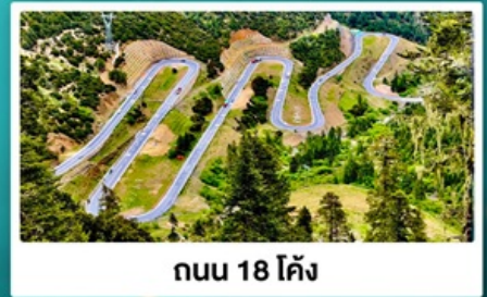
ถนน 18 โค้ง