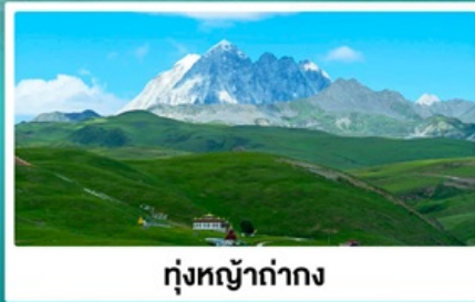
ทุ่งหญ้าท่ามกลาง