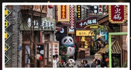
หมู่บ้านสี่牌坊