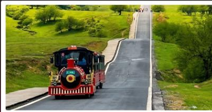
หุบเขานางฟ้า