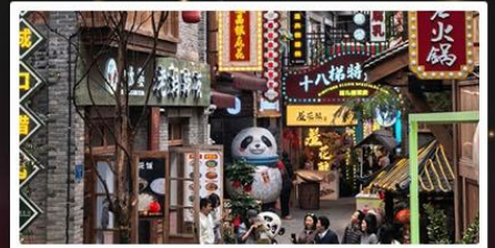
หมู่บ้านสี่牌坊