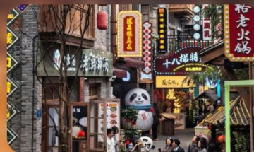
หมู่บ้านสี่ปาตี้