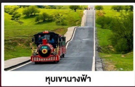
หุบเขานางฟ้า