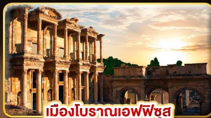
เมืองโบราณเอฟเฟซุส