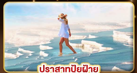
ปราสาทบิวไฟาย