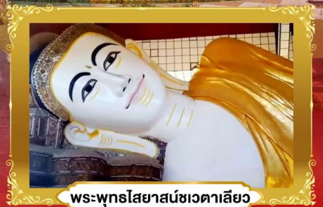
พระพุทธรูปไสยาสน์ชเวตาเลีย