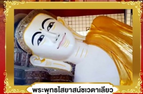
พระพุทธรไสยาสน์ชเวตาเลียว