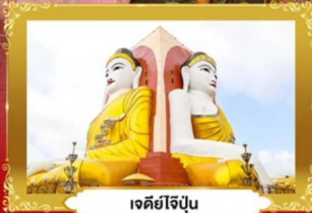
เจดีย์ไจ้ปุ่น