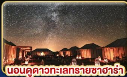
นอนดูดาวทะเลทรายซาฮารา