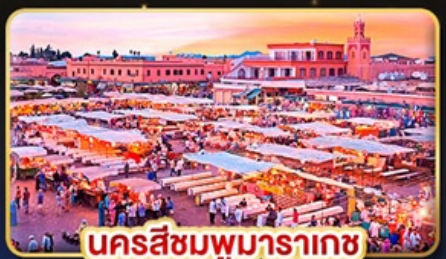
นครสีชมพูมารากะช