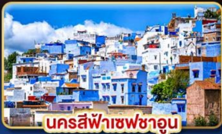
นครสีฟ้าเซฟซาอูน

ท่องเที่ยวดินแดนฟ้าจรดทราย เก็บทุกไฮไลท์ใน โมร็อกโก อารยธรรมสุดขอบทวีป