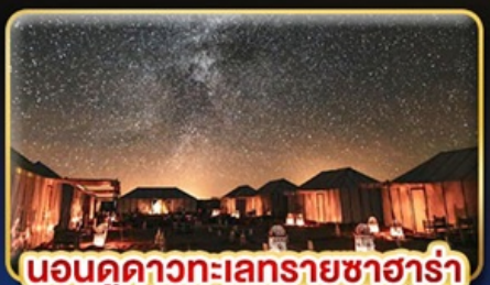
นอนดูดาวทะเลทรายซาฮารา