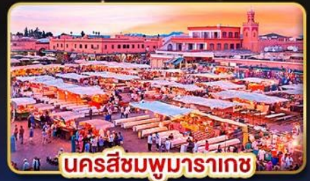
นครสีชมพูมารากะช