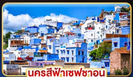
นครสีฟ้าเซฟซาอูน

📅เดินทาง: 19-28 ต.ค. | 05-14 ส.ค. 69 30 ส.ค. 69-08 ม.ค. 70