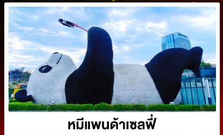
หมีแพนด้าเซลฟี