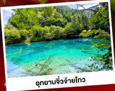
อุทยานจิ้งจายโกว

"เที่ยว 2 อุทยานสวรรค์" เที่ยวศูนย์อนุรักษ์หมีแพนด้าสุดน่ารัก