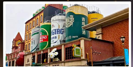
โรงแรมเบียร์ชิงเต่า