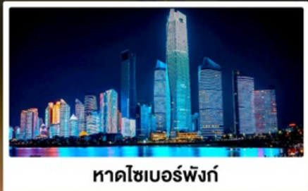
หาดไซเบอร์ฟังก์