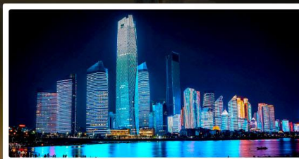
หาดไซเบอร์ฟังก์