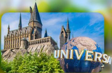
เลือกอิสระ Universal Studios Japan