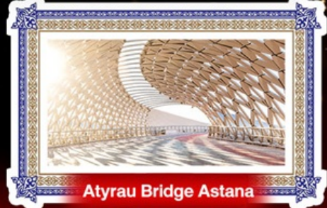
Atyrau Bridge Astana