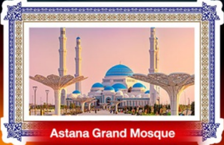
Astana Grand Mosque