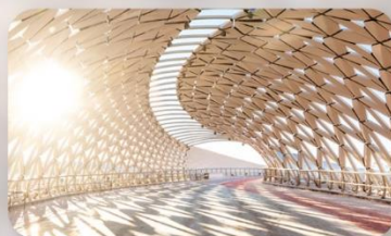
Ayrau Bridge Astana