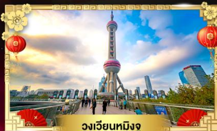
วงเวียนหมีงู