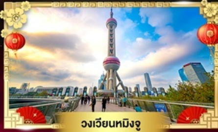
วงเวียนหมิงจู