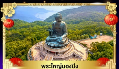
พระใหญ่องปิง