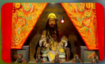
องค์แขกเก่า 600 ปี