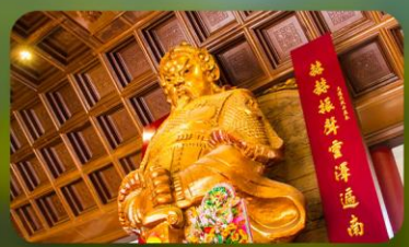
วัดแขกหมิว