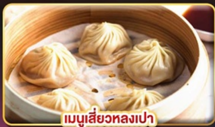
เมนูเสี่ยวหลงเปา