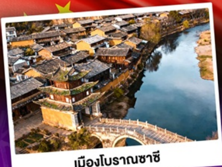
เมืองโบราณซาซี

ชมดอกไม้บานสะพรั่งทั่วยูนนาน "เซ็ดอี่แฉดาเฟ้ววี่สุดอลัง"