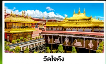
วัดโจคัง

🏠 พักบนรถไฟ 1 คืน ห้องละ 4 เตียง (บน 2/ล่าง 2)