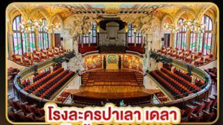
โรงละครปาลาเลา เตลา มูสิก้า คาสาลานา