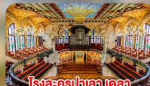
โรงละครปาลเลอ เดล มุสิก้า คาตาลาน