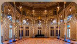
Palácio the Bolsa