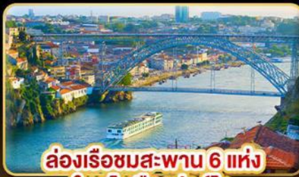
ล่องเรือชมสะพาน 6 แห่ง ในคูโรเมืองปอร์โต