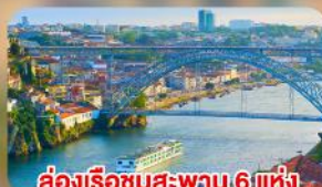
ส่องเรือชมสะพาน 6 แห่ง ในคูริเมืองปอร์โต