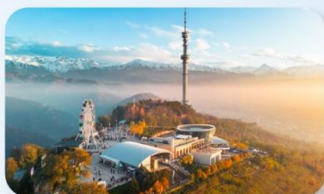
Kok Tobe Hill