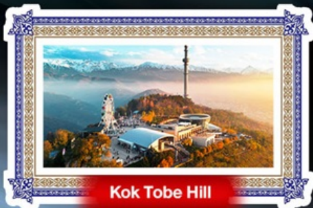
Kok Tobe Hill