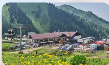
Shymbulak Ski Resort