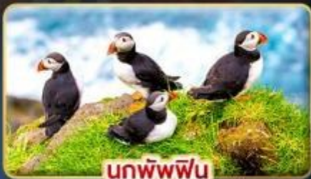
นกพิฟฟิน

📅 เดินทาง : 30 เม.ย. - 07 พ.ค. | 23-30 ก.ค. 69