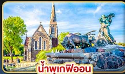
น้ำพุเทพีออน