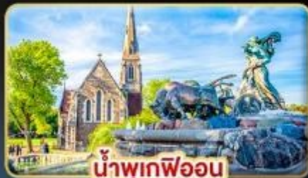
น้ำพุเทพีออน