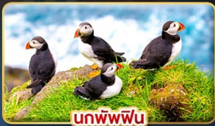
นกพิฟฟิน

📅 เดินทาง : 30 เม.ย. - 07 พ.ค. | 23-30 ก.ค. 69