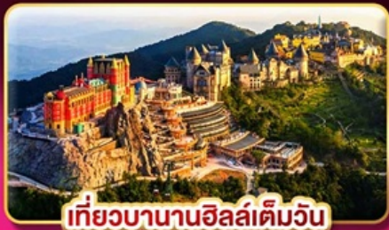
เที่ยวบานาฮิลล์เต็มวัน

ล่องกระทงขามดำคืนที่ฮอยอัน ไฟล์ทสวย บินเช้า-กลับเย็น