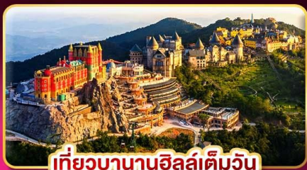
เที่ยวบานาฮิลล์เต็มวัน

ลองกระทงขามดำคืนที่ฮอยอัน ไฟล์ทสวย บินเช้า-กลับเย็น