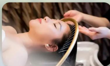
สระम्मสโตล์เวียดนาม