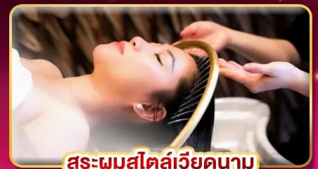
สระผมสไตล์เวียดนาม