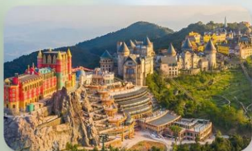
เที่ยวบานาฮิลล์เต็มวัน